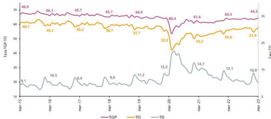
Gráfico 2. Tasa global de participación, ocupación y desempleo Total nacional Marzo (2015 – 2023)

Fuente: DANE, GEIH. Nota: datos expandidos con proyecciones de población, elaboradas con base en los resultados del CNPV 2018. Nota: cifras aproximadas a un decimal. Por efecto del redondeo los totales pueden diferir ligeramente del anexo.