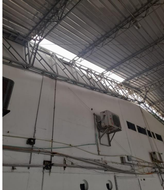
Imágenes 6 y 7. Estado deterioro instalaciones hidrosanitarias y eléctricas.