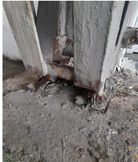
Imágenes 8 y 9. Estado de oxidación estructura metálicas.

En lo que concierne al Decreto de Austeridad del Gasto, la administración tuvo en cuenta las disposiciones establecidas en el Decreto 444 de 2023 "Por el cual se establece el Plan de Austeridad del Gasto 2023 para los órganos que hacen parte del Presupuesto General de la Nación" así.