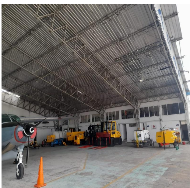
Imágenes 4 y 5. Estado deterioro de la estructura metálica.