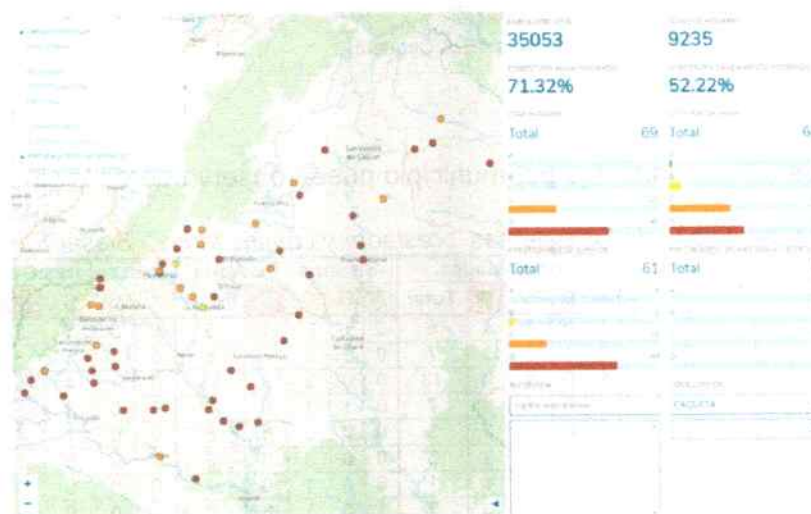
Ilustración 1. Visor puntos SIASAR

En el año 2019 el PDA realizó un piloto del SIASAR en el Departamento involucrando a catorce (14) municipios e interviniendo sesenta y nueve (69) comunidades, las cuales quedaron insertos en el programa internacional sistema de información de agua y saneamiento rural (SIASAR), los cuales quedaron debidamente registrados en la plataforma, es así que este material informativo es posible visualizarlo mediante de la utilización de cual sistema con acceso a internet, en la cual se reflejará los puntos del piloto SIASAR con sus respectivos semáforo, el cual indica el estado de avance que tiene cada sistema en cada uno de los sitios intervenidos, los cuales están disponibles en plataforma Siasar: http://www.siasar.org/es/paises/colombia .