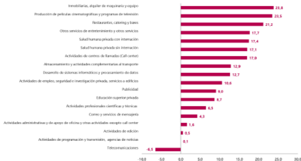
Gráfico 1. Variación anual de los ingresos nominales, según subsector de servicios Total nacional Marzo 2023P