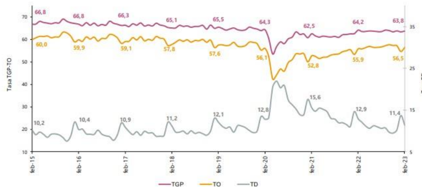
Gráfico 2. Tasa global de participación, ocupación y desempleo Total nacional Febrero (2015 – 2023)

a febrero de 2022 (64,2%). Finalmente, la tasa de ocupación fue 56,5%, lo que representó un aumento de 0,6 puntos porcentuales respecto al mismo mes de 2022 (55,9%).