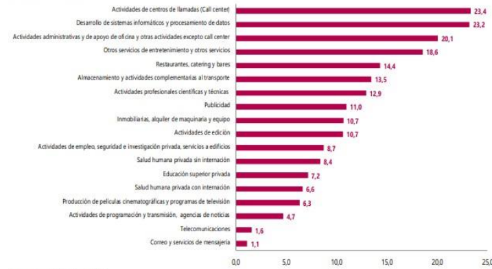
Gráfico 1. Variación anual de los ingresos nominales, según subsector de servicios Total nacional Diciembre 2022 P