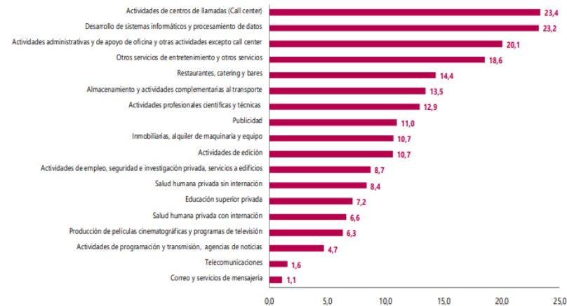
Gráfico 1. Variación anual de los ingresos nominales, según subsector de servicios Total nacional Diciembre 2022 P