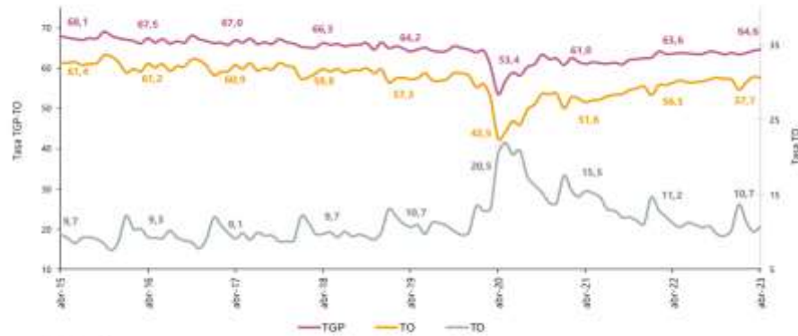
Gráfico 2. Tasa global de participación, ocupación y desempleo Total nacional Abril (2015 – 2023)