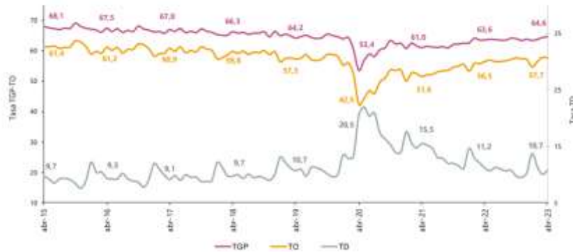
Gráfico 2. Tasa global de participación, ocupación y desempleo Total nacional Abril (2015 – 2023)