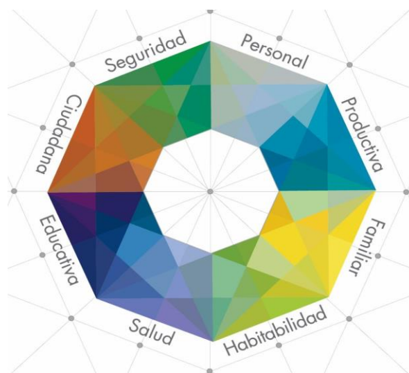
GRÁFICO 1. Dimensiones de la Ruta de Reintegración

Fuente: Gestión del Conocimiento. Intranet ARN. Marzo de 2017 8