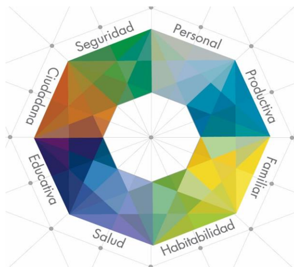
GRÁFICO 1. Dimensiones de la Ruta de Reintegración

Fuente: Gestión del Conocimiento. Intranet ARN. Marzo de 2017 8