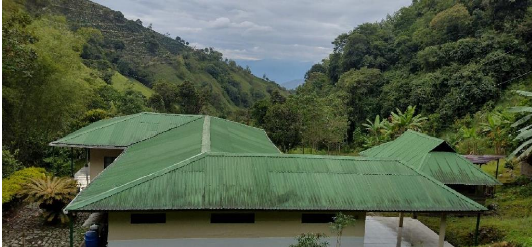
Fotografía: Estado actual de la cubierta en teja termoacústica.