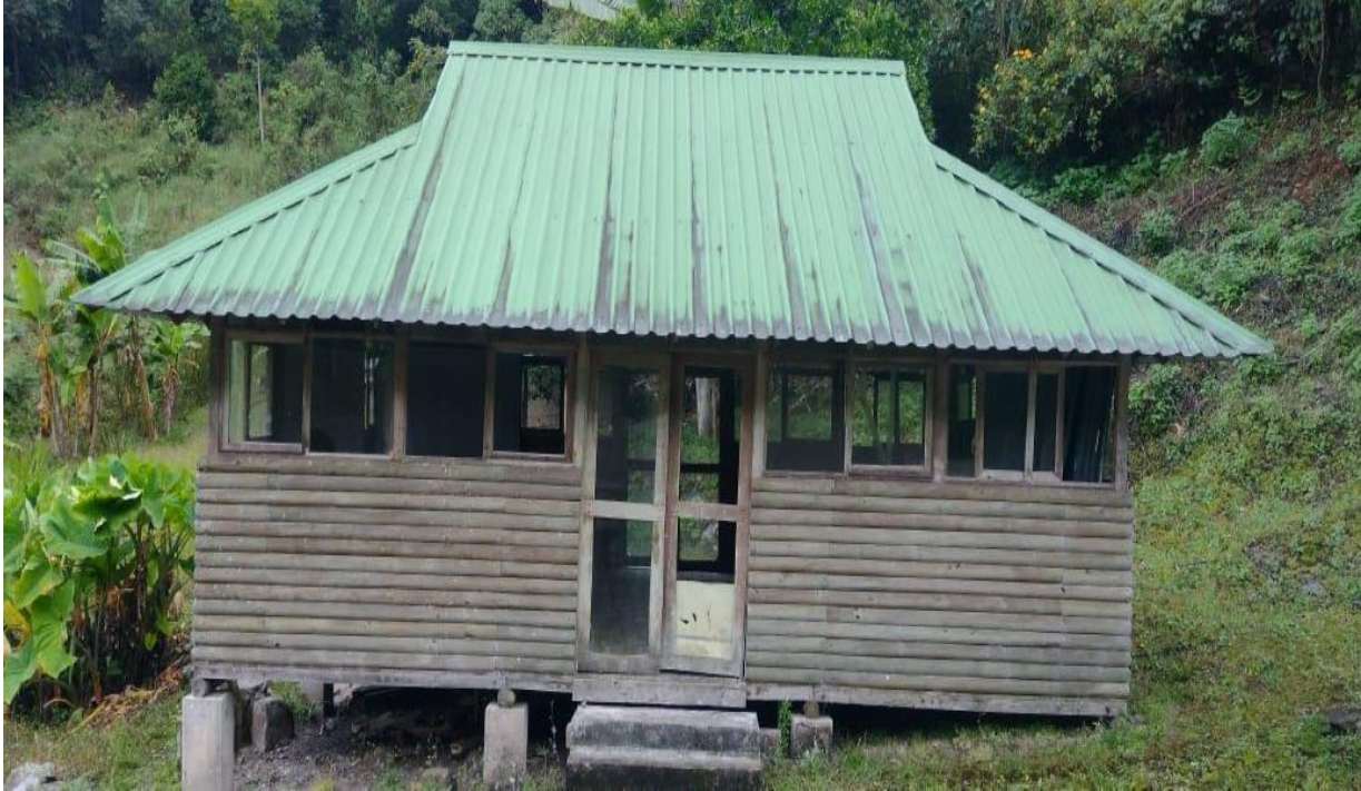
Fotografía: Estado actual de la cubierta en teja termoacústica y fachada en madera.

incluye el mantenimiento del tanque de almacenamiento de agua potable, red de distribución y el abastecimiento y tratamiento de agua para consumo, contemplando la limpieza y desinfección del sistema.