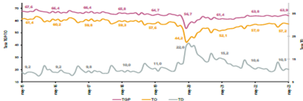
Gráfico 1. Tasa global de participación, ocupación y desempleo Total nacional Mayo (2015 – 2023)