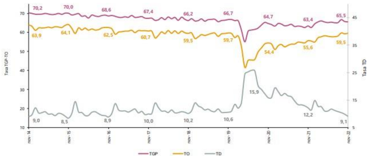
Gráfico 3. Tasa global de participación, ocupación y desempleo Total 13 ciudades y áreas metropolitanas Noviembre (2014 - 2022)

En total 13 ciudades y áreas metropolitanas mensual en noviembre de 2022, la tasa de desempleo en el total de las 13 ciudades y áreas metropolitanas fue 9,1%, lo que representó una reducción de 3,1 puntos porcentuales respecto al mismo mes de 2021 (12,2%). La tasa global de participación se ubicó en 65,5%, lo que significó un aumento de 2,1 puntos porcentuales respecto a noviembre de 2021 (63,4%). Finalmente, la tasa de ocupación fue 59,5%, lo que representó un aumento de 3,9 puntos porcentuales respecto al mismo mes de 2021 (55,6%).