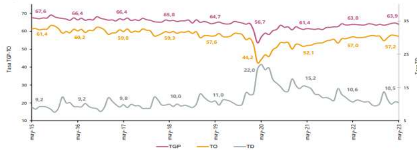
Gráfico 1. Tasa global de participación, ocupación y desempleo Total nacional Mayo (2015 – 2023)