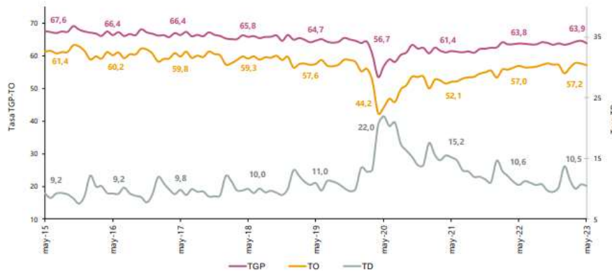
Gráfico 2. Tasa global de participación, ocupación y desempleo Total nacional Mayo (2015 – 2023)

Para el mes de mayo de 2023, la tasa de desempleo del total nacional fue 10,5%, la tasa global de participación se ubicó en 63,9% y la tasa de ocupación fue 57,2%. En el mismo mes de 2022, estas tasas se ubicaron en 10,6%, 63,8% y 57,0%, respectivamente.