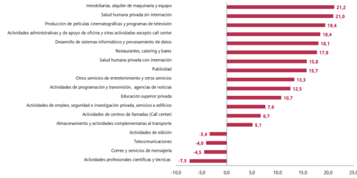
Gráfico 1. Variación anual de los ingresos nominales, según subsector de servicios Total nacional Junio 2023 p / junio 2022