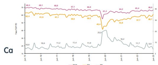
Gráfico 3. Tasa global de participación, ocupación y desempleo Total 13 ciudades y áreas metropolitanas Junio (2015 - 2023)

En junio de 2023, la tasa de desempleo en el total de las 13 ciudades y áreas metropolitanas fue 8,8%, lo que representó una disminución de 2,9 puntos porcentuales respecto al mismo mes de 2022 (11,7%). La tasa global de participación se ubicó en 66,6%, en junio de 2022 fue 65,4%. Finalmente, la tasa de ocupación fue 60,7%, lo que representó un aumento de 3,0 puntos porcentuales respecto al mismo mes de 2022 (57,7%).