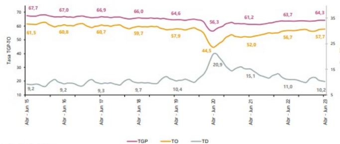
Gráfico 4. Tasa global de participación, ocupación y desempleo Total nacional Abril - junio (2015 - 2023)

En el total nacional, la tasa de desempleo del trimestre abril - junio de 2023 fue 10,2%, lo que representó una disminución de 0,8 puntos porcentuales respecto al trimestre abril - junio de 2022 (11,0%). La tasa global de participación se ubicó en 64,3%, lo que significó un aumento de 0,6 puntos porcentuales frente al trimestre abril - junio de 2022 (63,7%). Finalmente, la tasa de ocupación fue 57,7%, lo que representó un aumento de 1,1 puntos porcentuales respecto al trimestre abril - junio de 2022 (56,7%).