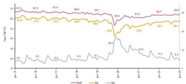
Gráfico 2. Tasa global de participación, ocupación y desempleo Total nacional Junio (2015 – 2023)

Para el mes de junio de 2023, la tasa de desempleo del total nacional fue 9,3%, lo que representó una disminución de 1,9 puntos porcentuales respecto al mismo mes de 2022 (11,3%). La tasa global de participación se ubicó en 64,3%, en junio de 2022 fue 63,7%. Finalmente, la tasa de ocupación fue 58,3%, lo que representó un aumento de 1,8 puntos porcentuales respecto al mismo mes de 2022 (56,5%).