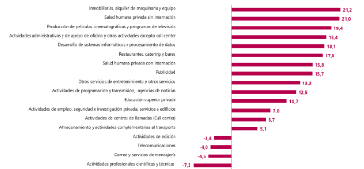
Gráfico 1. Variación anual de los ingresos nominales, según subsector de servicios Total nacional Junio 2023 P / junio 2022