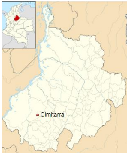
Figura 1: Municipio de Cimitarra.

La localización geográfica del municipio y de la PTAP AGUAS DE CIMITARRA S.A.S. E.S.P , que es donde se implementara el proyecto, se observa en las siguientes figuras: