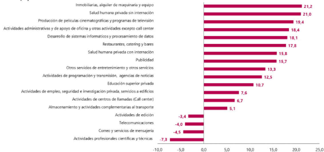
Gráfico 1. Variación anual de los ingresos nominales, según subsector de servicios Total nacional Junio 2023p / junio 2022