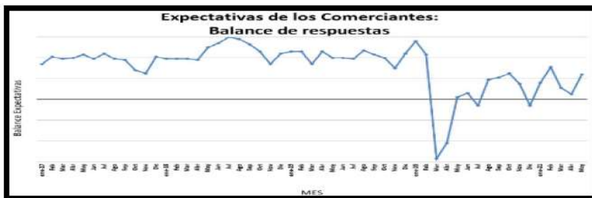
Gráfica 3. Balance expectativas de los comerciantes

Contrario a lo que pudiera esperarse, en mayo mejoró el estado de ánimo de los comerciantes. El 38% de los encuestados consideró que sus actividades empresariales en el curso de los próximos seis meses mejorarán frente a la situación actual y el 14% se declaró pesimista. En la siguiente gráfica se puede evidenciar el balance de las respuestas de los comerciantes (respuestas positivas menos respuestas negativas) el cual fue de 24 al mes de mayo.