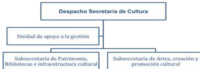
Ilustración 1. Estructura organizacional Secretaría de Cultura - Distrito de Santiago de Cali