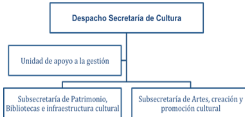
Ilustración 1. Estructura organizacional Secretaría de Cultura - Distrito de Santiago de Cali

Fuente: Elaboración propia. Datos tomados del Decreto extraordinario No. 411.0.20.0516 de septiembre 28 de 201