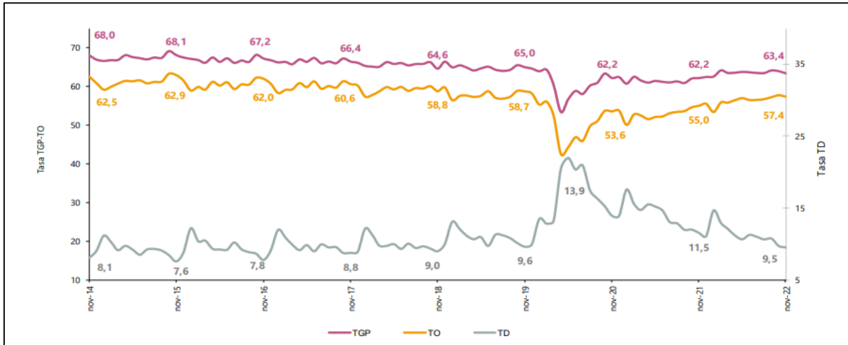
Gráfico 1. Tasa global de participación, ocupación y desempleo Total nacional Noviembre (2014 – 2022)

Todo lo anterior se puede evidenciar en el siguiente gráfico: