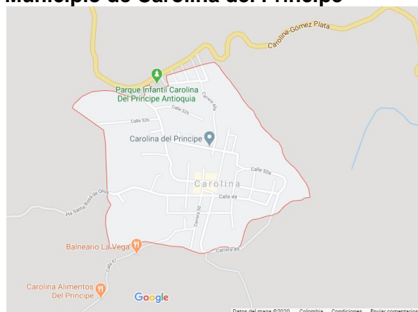
Imagen tomada de https://www.google.com/maps/place/Carolina,+Antioquia/@6.724935,-75.2841068,15.75z/data=!4m5!3m4!1s0x8e4466459575f30d:0x594da5e5e7013e3218m2!3d6.7237546!4d-75.2811105?hl=es