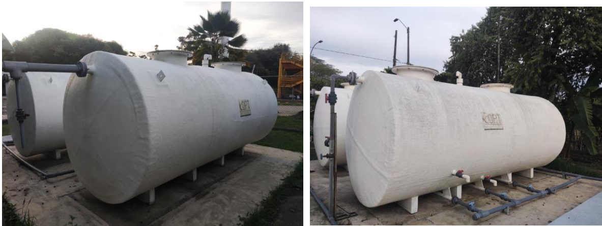
Planta Bloque A

La sede del sur no cuenta con servicio de alcantarillado por parte de las Empresas Municipales de Cali EMCALI. No obstante, posee un sistema de tratamiento de agua (PTAR). La cual cuenta con pozos para el almacenamiento de sólidos, aguas grises y negras generadas por la comunidad estudiantil y administrativa al utilizar los distintos puntos Hidrosanitarios, en la actualidad por las por mal uso de las baterías sanitaria se requiere el retiro de solidos de los tanques de almacenamiento primeros y pozos sépticos.