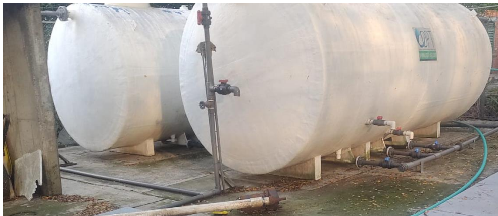
Planta Bloque Campestre