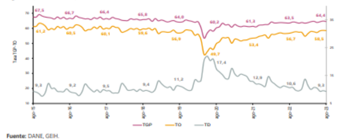
Gráfico 1. Tasa global de participación, ocupación y desocupación Total nacional Agosto (2015 - 2023)

En agosto de 2023, la tasa de desocupación en el total de las 13 ciudades y áreas metropolitanas fue 9,6%, lo que representó una disminución de 1,2 puntos porcentuales respecto al mismo mes de 2022 (10,8%). La tasa global de participación se ubicó en 66,4%, lo que significó un aumento de 1,3 puntos porcentuales frente a agosto de 2022 (65,1%). Finalmente, la tasa de ocupación fue 60,0%, lo que representó un aumento de 2,0 puntos porcentuales respecto al mismo mes de 2022 (58,1%).