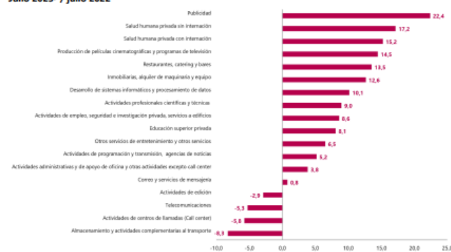
Gráfico 1. Variación anual de los ingresos nominales, según subsector de servicios Total nacional Julio 2023 p / julio 2022

En lo corrido de 2023, dieciséis de los dieciocho subsectores de servicios presentaron variación positiva en los ingresos, trece presentaron variación positiva en el personal ocupado total y todos los subsectores presentaron variación positiva en los salarios, en comparación con el mismo periodo de 2022.