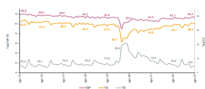
Gráfico 3. Tasa global de participación, ocupación y desocupación Total 13 ciudades y áreas metropolitanas Agosto (2015 - 2023)

Fuente: https://www.dane.gov.co/files/operaciones/GEIH/bol-GEIH-ago2023 (Septiembre de 2023)