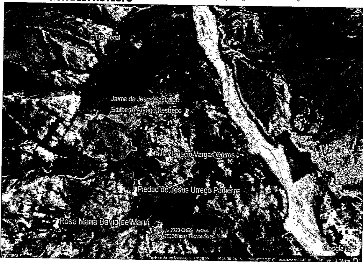
Georreferenciación de la zona objeto del presente documento

Con el fin de garantizar el cumplimiento de las obligaciones descritas, atendiendo a los análisis técnicos y económicos realizados por el conveniente y teniendo en cuenta que dentro de la