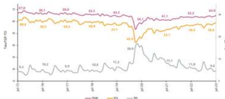
Gráfico 2. Tasa global de participación, ocupación y desocupación Total nacional Julio (2015 - 2023)

Para el mes de julio de 2023, la tasa de desocupación del total nacional fue 9,6%, lo que representó una disminución de 1,4 puntos porcentuales respecto al mismo mes de 2022 (11,0%). La tasa global de participación se ubicó en 64,8%, lo que significó un aumento de 1,3 puntos porcentuales frente a julio de 2022 (63,5%). Finalmente, la tasa de ocupación fue 58,6%, lo que representó un aumento de 2,1 puntos porcentuales respecto al mismo mes de 2022 (56,5%).