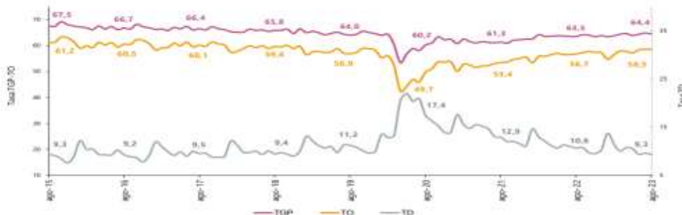
Gráfico 2. Tasa global de participación, ocupación y desocupación Total nacional Agosto (2015 - 2023)

Para el mes de agosto de 2023, la tasa de desocupación del total nacional fue 9,3%, lo que representó una disminución de 1,4 puntos porcentuales respecto al mismo mes de 2022 (10,6%). La tasa global de participación se ubicó en 64,4%, lo que significó un aumento de 1,0 puntos porcentuales frente a agosto de 2022 (63,5%). Finalmente, la tasa de ocupación fue 58,5%, lo que representó un aumento de 1,7 puntos porcentuales respecto al mismo mes de 2022 (56,7%).