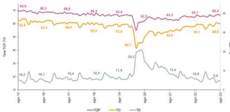
Gráfico 3. Tasa global de participación, ocupación y desocupación Total 13 ciudades y áreas metropolitanas Agosto (2015 - 2023)

En agosto de 2023, la tasa de desocupación en el total de las 13 ciudades y áreas metropolitanas fue 9,6%, lo que representó una disminución de 1,2 puntos porcentuales respecto al mismo mes de 2022 (10,8%). La tasa global de participación se ubicó en 66,4%, lo que significó un aumento de 1,3 puntos porcentuales frente a agosto de 2022 (65,1%). Finalmente, la tasa de ocupación fue 60,0%, lo que representó un aumento de 2,0 puntos porcentuales respecto al mismo mes de 2022 (58,1%).