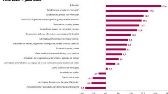
Gráfico 1. Variación anual de los ingresos nominales, según subsector de servicios Total nacional Julio 2023 p / julio 2022

En lo corrido de 2023, dieciséis de los dieciocho subsectores de servicios presentaron variación positiva en los ingresos, trece presentaron variación positiva en el personal ocupado total y todos los subsectores presentaron variación positiva en los salarios, en comparación con el mismo periodo de 2022.