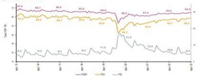
Gráfico 1. Tasa global de participación, ocupación y desocupación Total nacional Agosto (2015 - 2023)