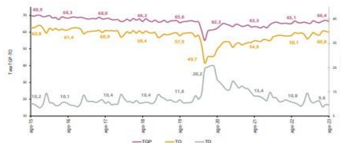
Gráfico 3. Tasa global de participación, ocupación y desocupación Total 13 ciudades y áreas metropolitanas Agosto (2015 - 2023)

En agosto de 2023, la tasa de desocupación en el total de las 13 ciudades y áreas metropolitanas fue 9,6%, lo que representó una disminución de 1,2 puntos porcentuales respecto al mismo mes de 2022 (10,8%). La tasa global de participación se ubicó en 66,4%, lo que significó un aumento de 1,3 puntos porcentuales frente a agosto de 2022 (65,1%). Finalmente, la tasa de ocupación fue 60,0%, lo que representó un aumento de 2,0 puntos porcentuales respecto al mismo mes de 2022 (58,1%).