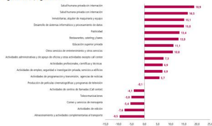
Gráfico 1. Variación anual de los ingresos nominales, según subsector de servicios Total nacional Agosto 2023 p / agosto 2022

En lo corrido de 2023, dieciséis de los dieciocho subsectores de servicios presentaron variación positiva en los ingresos, trece presentaron incremento en el personal ocupado total y todos los subsectores presentaron aumento en los salarios, en comparación con el mismo periodo de 2022.