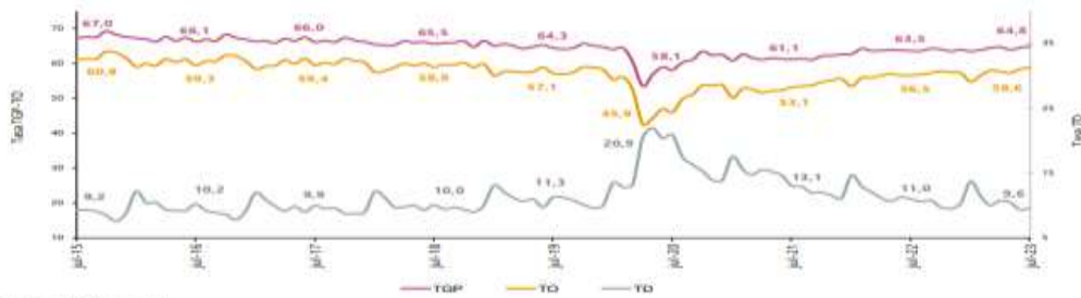
Gráfico 2. Tasa global de participación, ocupación y desocupación Total nacional Julio (2015 - 2023)