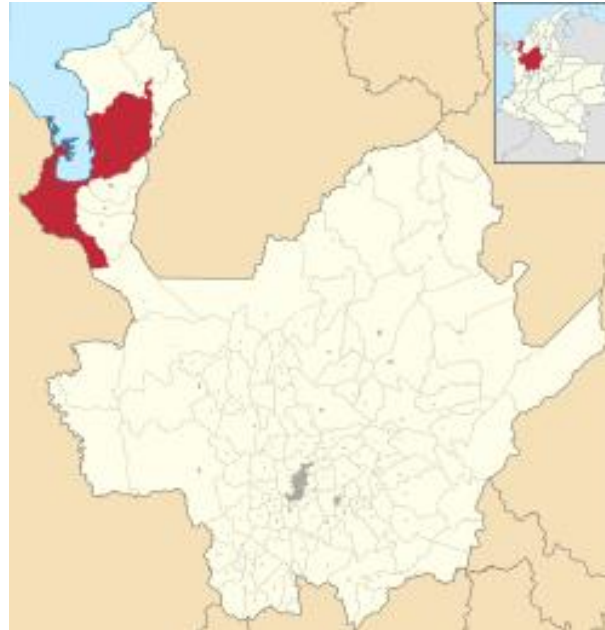
Ilustración 5 Municipio de Turbo