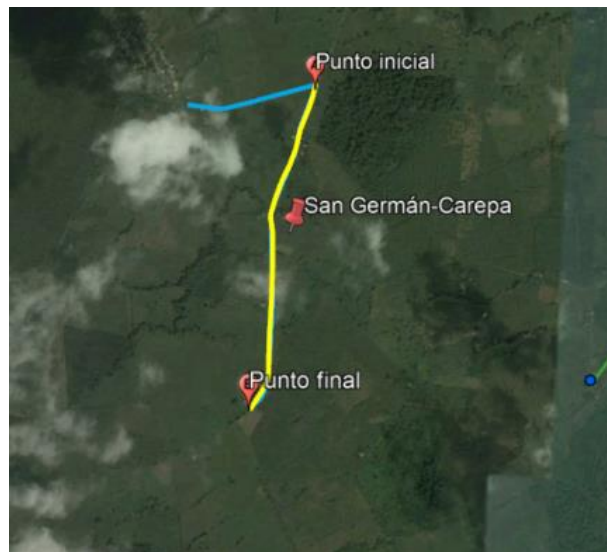
Ilustración 4 Localización vía a intervenir en vereda San German