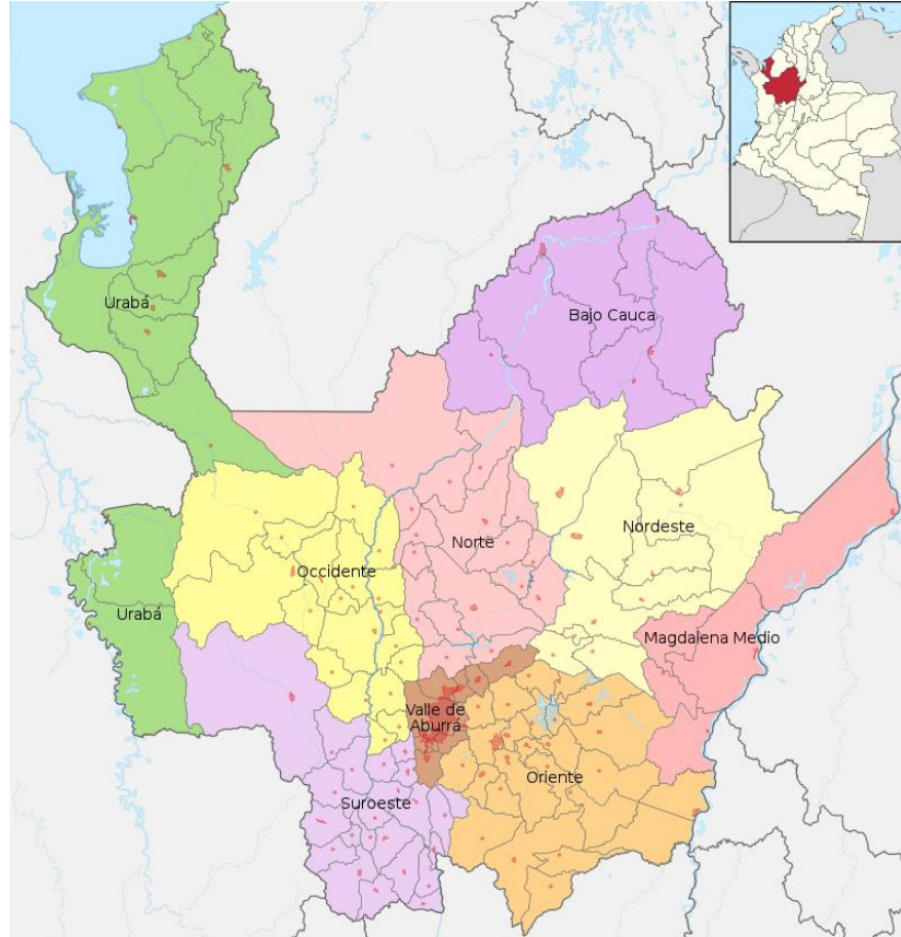
Ilustración 1. Departamento de Antioquia