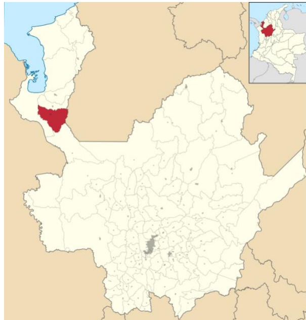
Ilustración 2. Municipio de Chigorodó