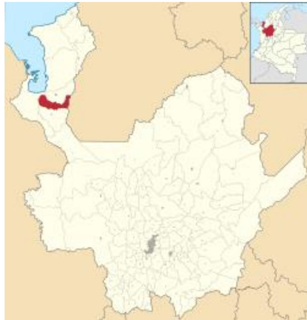
Ilustración 4. Municipio de Carepa