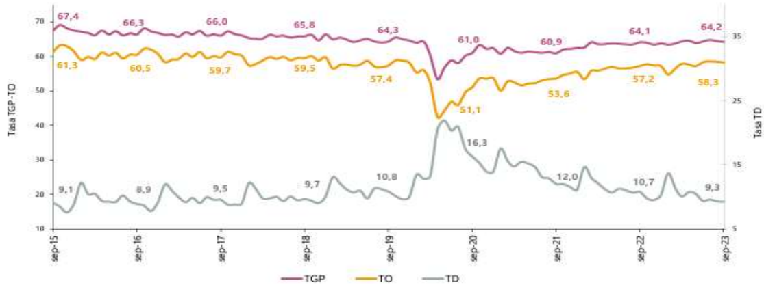
Gráfico. Tasa global de participación, ocupación y desocupación Total nacional Septiembre (2015 - 2023)

Para el mes de septiembre de 2023, la tasa de desocupación del total nacional fue 9,3%, lo que representó una disminución de 1,5 puntos porcentuales respecto al mismo mes de 2022 (10,7%). La tasa global de participación se ubicó en 64,2%, mientras que en septiembre de 2022 fue 64,1%. Finalmente, la tasa de ocupación fue 58,3%, lo que representó un aumento de 1,0 puntos porcentuales respecto al mismo mes de 2022 (57,2%).