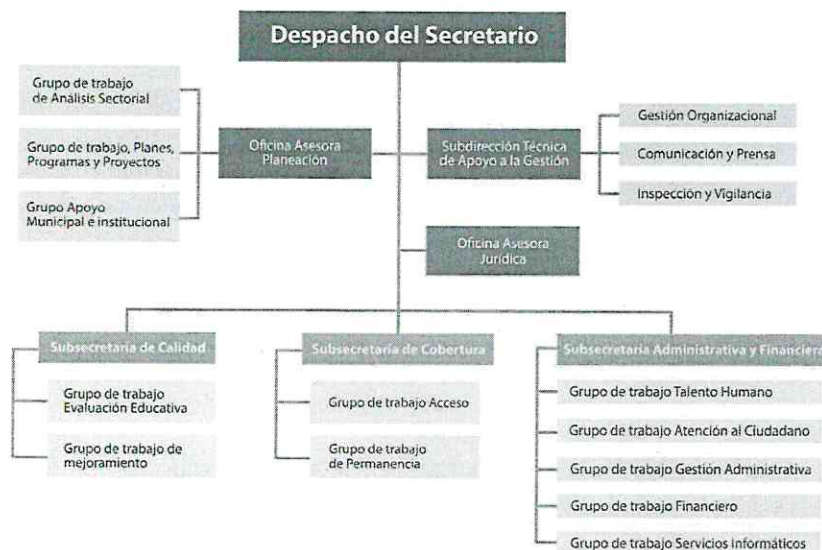
Ilustración 2. Organigrama del

El organigrama de la Secretaría de Educación estipulada según Decreto No. 1-3-1-1638 del 23 de Octubre de 2020, "Por el cual se ajusta la estructura orgánica de la administración central del Departamento del Valle del Cauca se definen las funciones de sus dependencias y se dictan otras disposiciones".