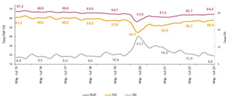
Gráfico 4. Tasa global de participación, ocupación y desocupación Total nacional Mayo - julio (2015 - 2023)

En el total nacional, la tasa de desocupación del trimestre móvil mayo - julio de 2023 fue 9,8%, lo que representó una disminución de 1,2 puntos porcentuales respecto al trimestre móvil mayo - julio de 2022 (11,0%). La tasa global de participación se ubicó en 64,3%, lo que significó un aumento de 0,7 puntos porcentuales frente al trimestre móvil mayo - julio de 2022 (63,7%). Finalmente, la tasa de ocupación fue 58,0%, lo que representó un aumento de 1,4 puntos porcentuales respecto al trimestre móvil mayo - julio de 2022 (56,7%).