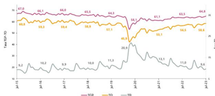
Gráfico 2. Tasa global de participación, ocupación y desocupación Total nacional Julio (2015 - 2023)

Para el mes de julio de 2023, la tasa de desocupación del total nacional fue 9,6%, lo que representó una disminución de 1,4 puntos porcentuales respecto al mismo mes de 2022 (11,0%). La tasa global de participación se ubicó en 64,8%, lo que significó un aumento de 1,3 puntos porcentuales frente a julio de 2022 (63,5%). Finalmente, la tasa de ocupación fue 58,6%, lo que representó un aumento de 2,1 puntos porcentuales respecto al mismo mes de 2022 (56,5%).