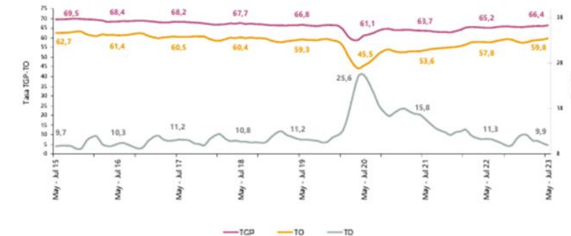
Gráfico 5. Tasa global de participación, ocupación y desocupación Total 13 ciudades y áreas metropolitanas Mayo - julio (2015 - 2023)

En el trimestre móvil mayo - julio de 2023, la tasa de desocupación de las 13 ciudades y áreas metropolitanas fue 9,9%, lo que representó una disminución de 1,4 puntos porcentuales respecto al trimestre móvil mayo - julio de 2022 (11,3%). La tasa global de participación se ubicó en 66,4%, lo que significó un aumento de 1,3 puntos porcentuales frente al trimestre móvil mayo - julio de 2022 (65,2%). Finalmente, la tasa de ocupación fue 59,8%, lo que representó un aumento de 2,0 puntos porcentuales respecto al trimestre móvil mayo - julio de 2022 (57,8%).