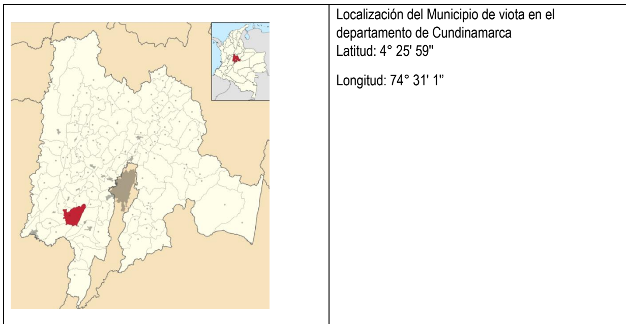
Figura 1. Localización de los proyectos