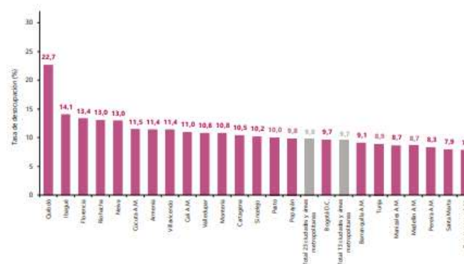
Gráfico 6. Tasa de desocupación según ciudades 23 ciudades y áreas metropolitanas Julio - septiembre 2023

Para el trimestre julio – septiembre 2023, de las 23 ciudades y áreas metropolitanas, las que presentaron mayores tasas de desocupación fueron: Quibdó (22,7%), Ibagué (14,1%) y Florencia (13,4%). Las ciudades con menor tasa de desocupación fueron: Bucaramanga A.M. (7,9%), Santa Marta (7,9%) y Pereira A.M. (8,3%).