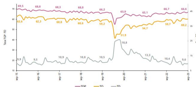
Gráfico 3. Tasa global de participación, ocupación y desocupación Total 13 ciudades y áreas metropolitanas Septiembre (2015 - 2023)

Fuente: https://www.dane.gov.co/index.php/estadisticas-por-tema/mercado-laboral/empleo-y-desempleo