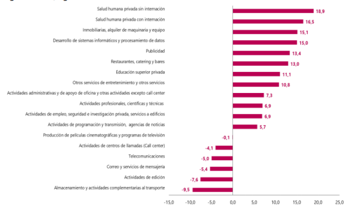
Gráfico 1. Variación anual de los ingresos nominales, según subsector de servicios Total nacional Agosto 2023 P / agosto 2022