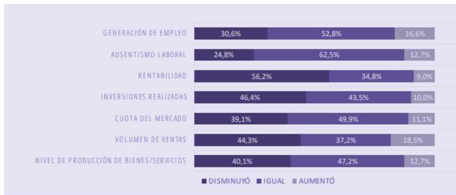
Gráfico 3. Comportamiento de los principales indicadores durante el tercer trimestre de 2022 en comparación con el tercer trimestre de 2022

Luego de observar los resultados estadísticos generados por la Encuesta de Desempeño Empresarial realizada por el Observatorio MiPyme de esta institución, se concluye que: en promedio, el 40,2% de empresarios del segmento MiPyme manifestaron presentar disminuciones en los indicadores mencionados anteriormente durante el tercer trimestre de 2022, mientras que solo el 12,9% percibió aumento y el 46,8% afirmó que los indicadores mencionados se mantuvieron con respecto al trimestre anterior.