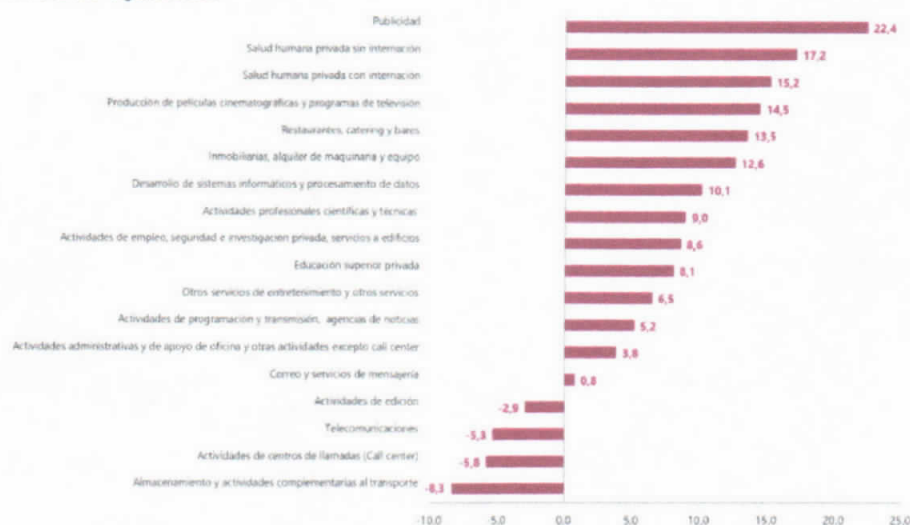
Gráfico 1. Variación anual de los ingresos nominales, según subsector de servicios Total nacional Julio 2023 p / julio 2022