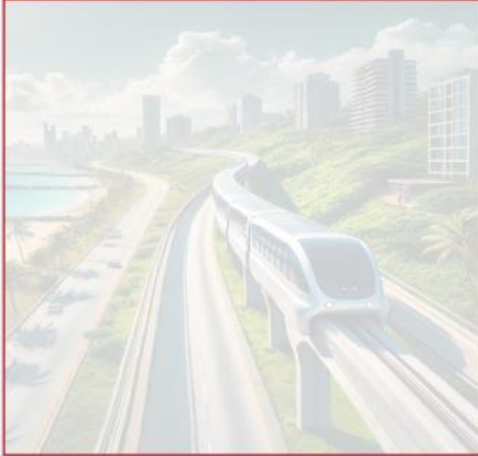
Anexo 05. Propuesta de Proyecto “IMPLEMENTACIÓN DE UN SISTEMA DE TRANSPORTE MASIVO LIVIANO EN EL DEPARTAMENTO DEL ATLÁNTICO: UNA APUESTA PARA MEJORAR LA MOVILIDAD E INCREMENTAR EL TURISMO”