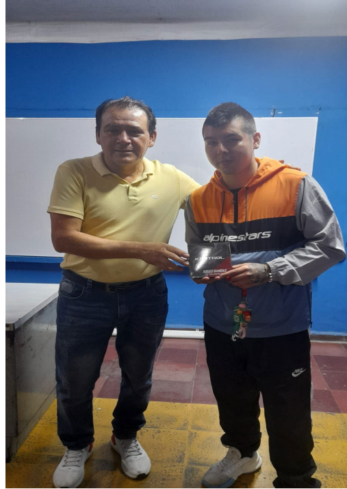
ENTREGA DE MATERIALES DE FORMACIÒN FICHA No 3111325