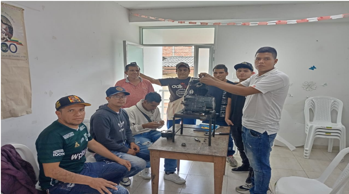
Pràcticas de diagnòstico, desarme y arme de motores de 4 tiempos