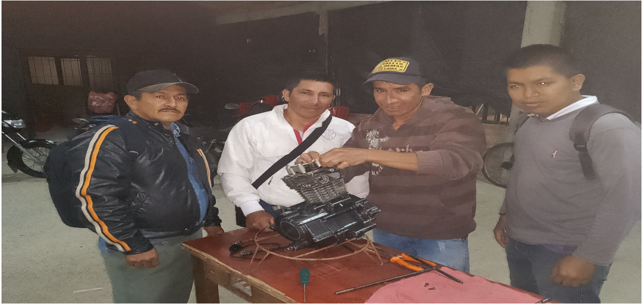
DESARME Y ARME DE MOTORES DE 2 Y 4TIEMPOS , Actividades en grupo de trabajo

Ficha No 3111325 Mantenimiento de motores de 2 y 4 tiempos en equipos utilitarios Popayán Cauca, Polideportivo barrio San José