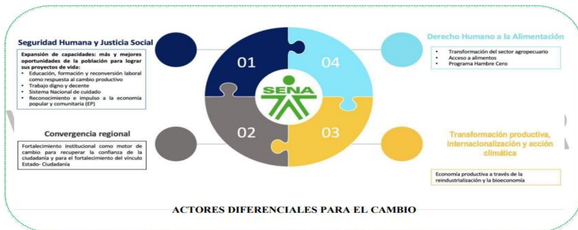
Ilustración 4 Alineación con Plan Nacional de Desarrollo 2022 – 2026

El Plan Estratégico 2023-2026 (Versión 2) define la proyección institucional hasta 2026, con visión a 2030, basándose en los principios, valores, compromisos, misión, visión, perspectivas, objetivos, iniciativas e indicadores estratégicos. El mapa estratégico resultante visualiza la estructura de la estrategia a través de objetivos orientados a la creación de valor público, definiendo las acciones, los derechos garantizados y las prioridades de la administración, en línea con las directrices del gobierno nacional.