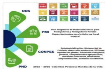
Ilustración 3 Alineación estratégica institucional

Adicionalmente, el modelo de articulación de la planeación estratégica y operativa de la Entidad, contempla en su alineación estratégica las agendas internacionales que impactan el quehacer institucional, principalmente los Objetivos de Desarrollo Sostenible, los principios del trabajo decente de la Organización Internacional del Trabajo (OIT), los compromisos institucionales en los planes que conforman el Plan Marco de Implementación, específicamente los relacionados con la reforma rural integral, los cuales aportan al logro de la paz total y la justicia social.