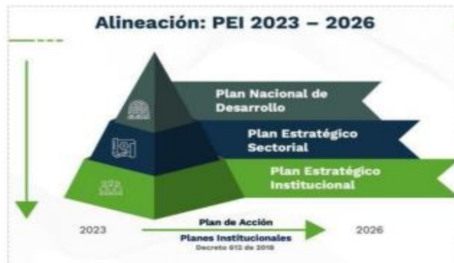
Ilustración 2 Alineación normativa PEI 2023 – 2026

El Plan estratégico institucional atiende el marco regulatorio de la planeación en el país, que señala como todas las entidades deben formular su plan estratégico de acuerdo con el plan nacional de desarrollo. La Ley 152 de 1994 señala como cada uno de los organismos públicos, con base en los lineamientos del Plan Nacional de Desarrollo y de las funciones que le señale la ley, deberá elaborar un plan indicativo cuatrienal (plan estratégico) con planes de acción anuales que se constituirá en la base para la posterior evaluación de resultados. Así mismo, el Decreto 612 de 2018 señala las directrices para la integración de los planes institucionales y estratégicos al Plan de Acción por parte de las entidades del Estado.