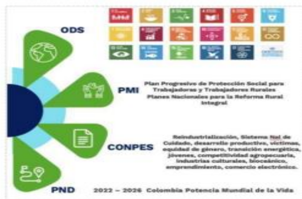
Ilustración 3 Alineación estratégica institucional

Colombia a través del documento CONPES 3918 Estrategia para la Implementación de los Objetivos de Desarrollo Sostenible en Colombia (DNP, 2018) señala la ruta para la puesta en marcha de la Agenda 2030 y las metas a nivel país por cada objetivo de Desarrollo Sostenible.