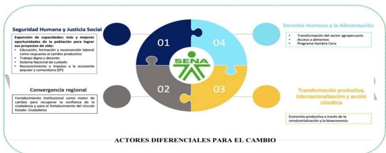
Ilustración 4 Alineación con Plan Nacional de Desarrollo 2022 – 2026

El Plan Estratégico 2023 – 2026 establece los elementos direccionados para la proyección institucional hasta el año 2026, con visión al 2030, sustentado en los principios, valores y compromisos institucionales, la misión, la visión, las perspectivas, los objetivos estratégicos, las iniciativas y los indicadores estratégicos. El mapa estratégico formulado permite visualizar la forma en la cual se estructura la estrategia a través de objetivos estratégicos que tiene como finalidad la creación de valor público; así mismo definen lo que se debe o tiene que hacer, los derechos que se garantizan con el quehacer de la entidad y las prioridades fijadas por la administración en línea con las apuestas del gobierno nacional.