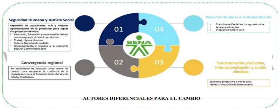
Ilustración 4 Alineación con Plan Nacional de Desarrollo 2022 – 2026

El Plan Estratégico 2023 – 2026 establece los elementos direccionados para la proyección institucional hasta el año 2026, con visión al 2030, sustentado en los principios, valores y compromisos institucionales, la misión, la visión, las perspectivas, los objetivos estratégicos, las iniciativas y los indicadores estratégicos. El mapa estratégico formulado permite visualizar la forma en la cual se estructura la estrategia a través de objetivos estratégicos que tiene como finalidad la creación de valor público; así mismo definen lo que se debe o tiene que hacer, los derechos que se garantizan con el quehacer de la entidad y las prioridades fijadas por la administración en línea con las apuestas del gobierno nacional.