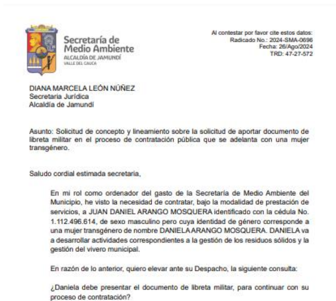
Figura No.6. Solicitud de concepto a jurídica.

5.1. Se realizó solicitud de concepto y lineamiento sobre el requerimiento de aportar documento de libreta militar en el proceso de contratación pública que se adelanta con una mujer transgénero, mediante el radicado No. 2024-SMA-0696. Figura 6. Fecha de realización 21/08/2024 (ver anexo 6).