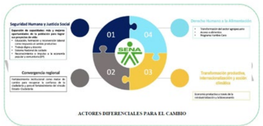
Fuente: Plan Estratégico Institucional SENA