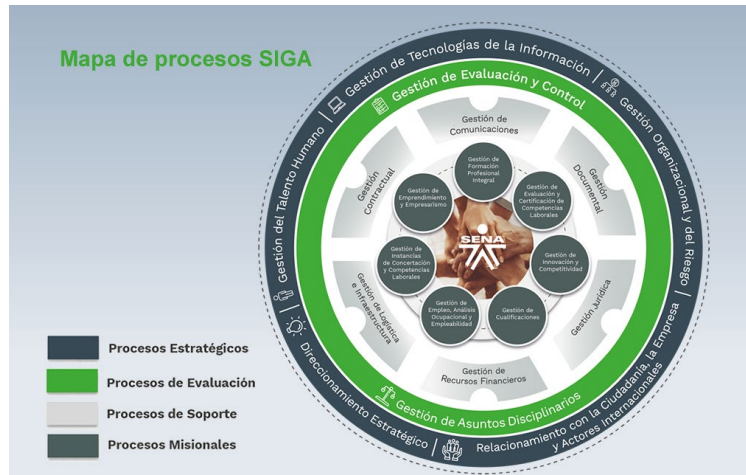
Fuente: sistema de gestión y autocontrol SENA.

Que de acuerdo con la Resolución No. 15-01274 de fecha 02 de septiembre de 2024, que modificó la estructura del Grupo de la Agencia pública de empleo del SENA, establece una conformación de grupo de trabajo, el cual estará conformado por los siguientes cargos: