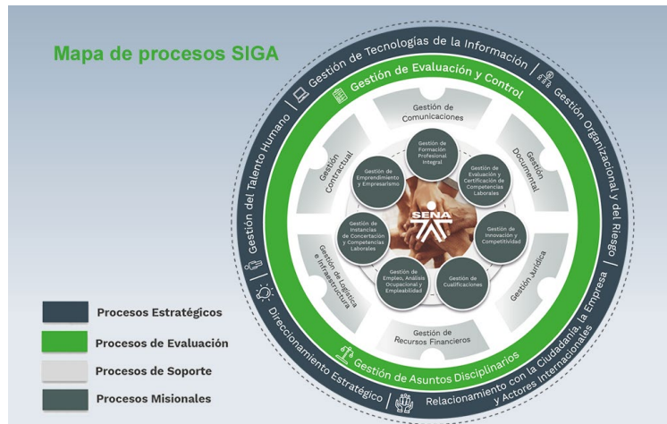
Fuente: sistema de gestión y autocontrol SENA.

financiera, sistema de gestión ambiental y energética, gestión documental y gestión de la formación profesional integral, lo anterior conforme a lo indicado en el mapa de proceso de la entidad – Sistema integrado de gestión y autocontrol – SIGA- y que le son aplicables al despacho regional , como los procesos de soporte y procesos misionales, así: