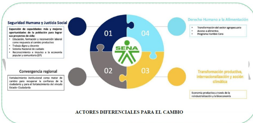
Ilustración 4 Alineación con Plan Nacional de Desarrollo 2022 – 2026