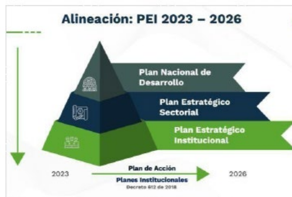
Ilustración 2 Alineación normativa PEI 2023 – 2026