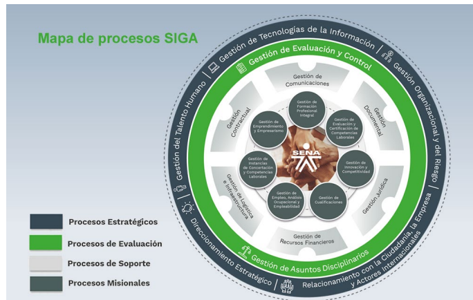
Fuente: sistema de gestión y autocontrol SENA.

sistema de gestión de calidad, atención al cliente interno y externo, gestión jurídica, gestión financiera, sistema de gestión ambiental y energética, gestión documental y gestión de la formación profesional integral, lo anterior conforme a lo indicado en el mapa de proceso de la entidad – Sistema integrado de gestión y autocontrol – SIGA- y que le son aplicables al despacho regional , como los procesos de soporte y procesos misionales, así: