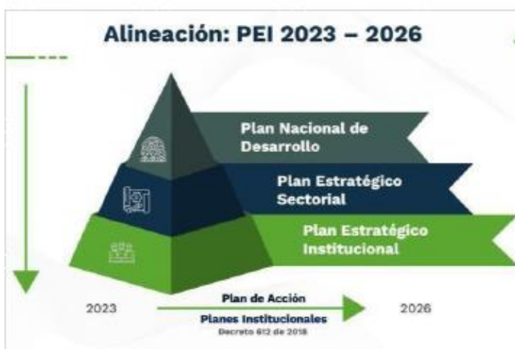
Ilustración 2 Alineación normativa PEI 2023 – 2026