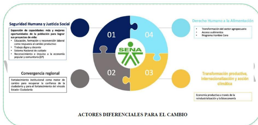
Ilustración 4 Alineación con Plan Nacional de Desarrollo 2022 – 2026