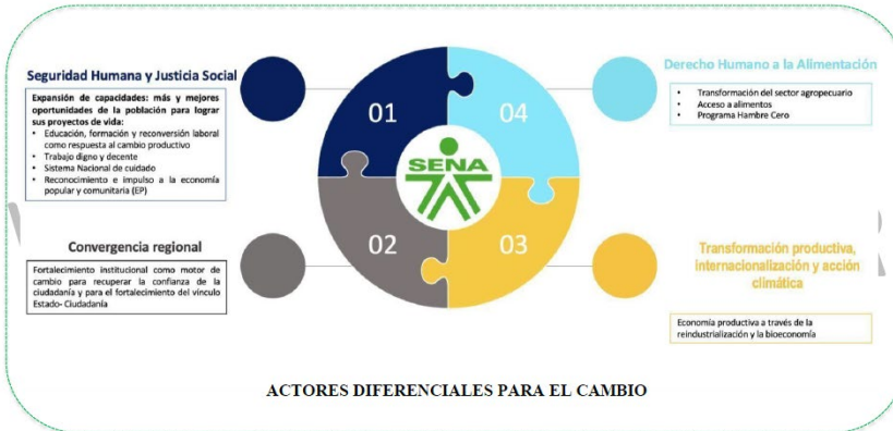
Ilustración 4 Alineación con Plan Nacional de Desarrollo 2022 – 2026

Fuente: Plan Estratégico Institucional SENA