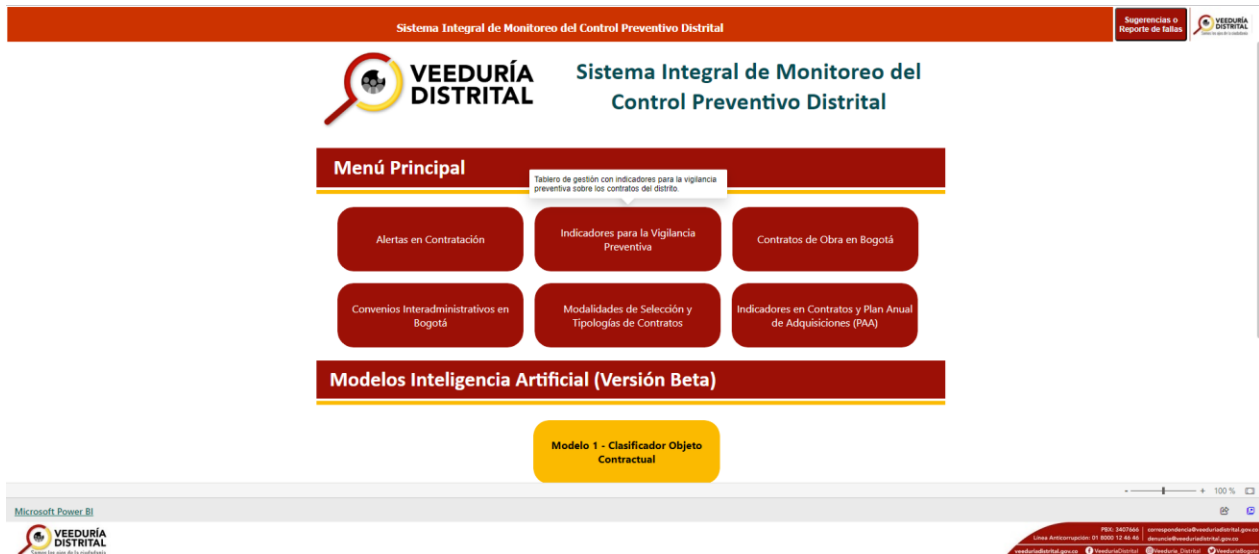
Figura 2. Diagrama de ventana de inicio