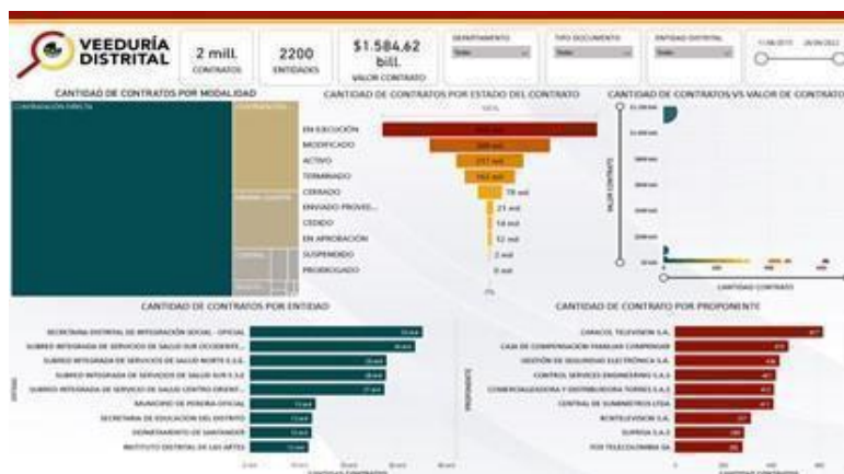
Figura 3. Diagrama de Gestión de información